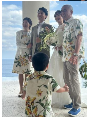
沖縄の結婚式場でしたので、親族おそろいの“かりゆし”を着ました。沖縄では“かりゆし”が正装だそうです。