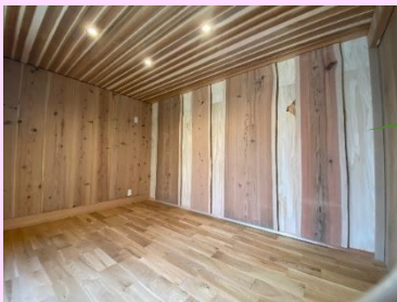
無垢材の木をふんだんに使ったキッズスペース

こちらは寝室です。お子さんと川の字になって寝たいとのことでしたので、低い小上がりの畳コーナーを設けました。