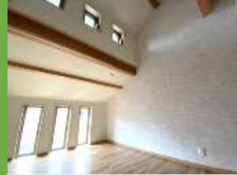
子供部屋にはそれぞれロフトを設置。 空間を有効活用しています。