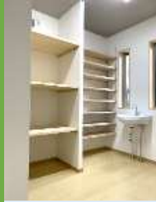
シューズクロークの中に 手洗器を設置。 玄関近くに手洗い 器をつけるお宅が 急増中です。