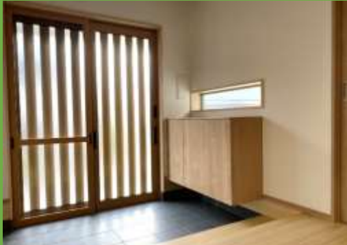
落ち着いた和の雰囲気の玄関 床は桧のフローリングです