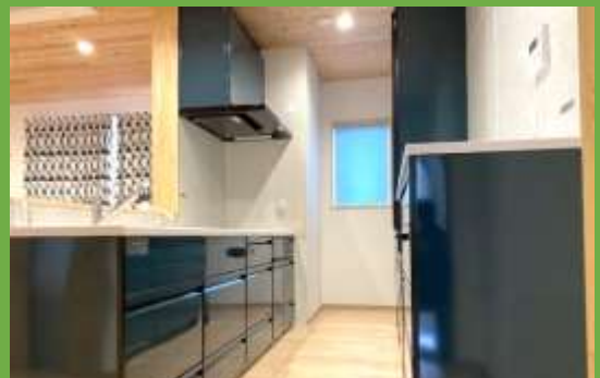
タカラスタンダードのシステムキッチン シックなグリーンが素敵です♪

新築させていただいたお宅が完成しました。一つ一つお施主様と相談しながら作り上げたお宅です。数ある業者の中から弊社を選んでいたいただいたことに心から感謝です。