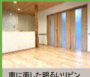
南に面した明るいリビング。 床は人気のサクラの 無垢材です。