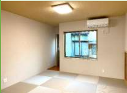
おばあちゃんの部屋。 直接外に出れるようになっています。