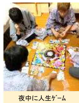
夜中に人生ゲーム

ただ、もうしばらく、ふんばらせていただきたいと思いますので、 本年も何卒よろしくお願ひ致します^^