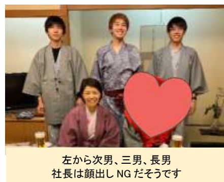
左から次男、三男、長男 社長は顔出し NG だそうです

社長に就任して20年という節目でもあったので、家族でお祝いをしました。2年ぶりかな？久しぶりに家族がそろい、とっても幸せな時間でした。