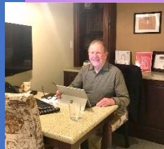
ニールケリーの社長様 人柄の良さがにじみ出てますね