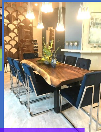
照明の使い方がとにかく素敵