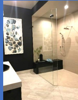
一般的なシャワールーム