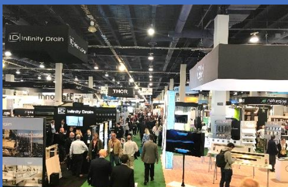
建材展示会場内(ビッグサイトを大きくした感じ)