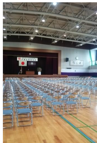
式が始まる前。 式は目に焼きつけようと思 い、一枚も撮りませんでした。

三男は、4月から新天地で、大好きな化学を学びます。学んだことを世の中や人 のお役にたてるような大人になってほしいと願っております。