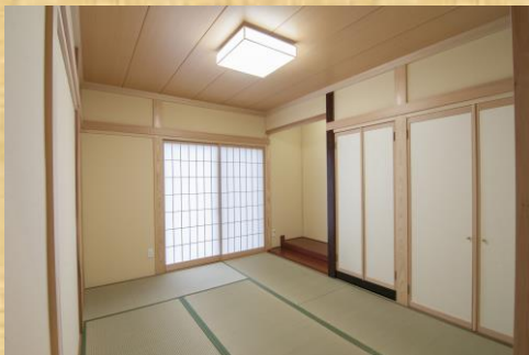
落ち着いた雰囲気の間