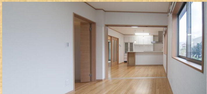
広々としたリビング&キッチン。急な来客時には、間仕切りで閉められるので、キッチンのゴトゴトを隠せます。