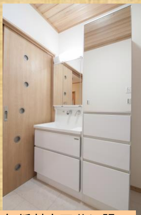
無垢材を天井に張ったので、調湿効果がある脱衣場