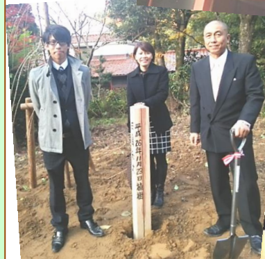
西島木材も社長と長男とで植樹しました