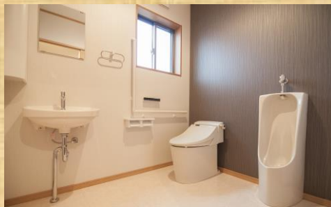
車イスでも入れる、広いトイレです