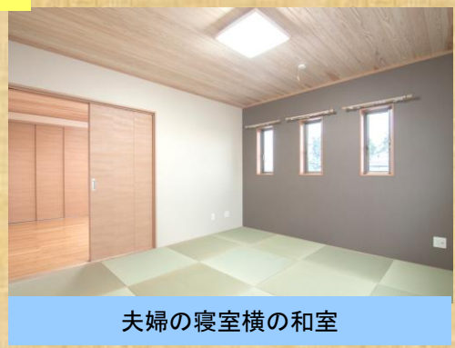
夫婦の寝室横の和室