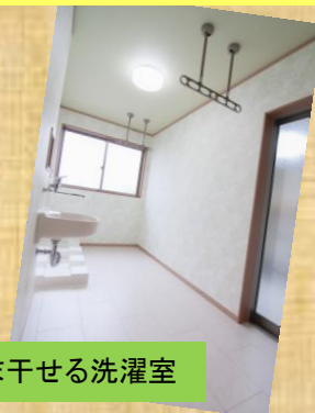
そのまま干せる洗濯室