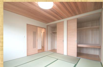
とっても明るいおばあちゃんの部屋