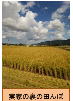
実家の裏の田んぼ

「米」って八十八と書きますよね。これは、お米がとれるまで八十八の工程があったからだそうです。今の工程はたぶん、5分の1もないような気がします。なので私も、兼業農家をやってやれないことはないかなあと思う今日この頃です。