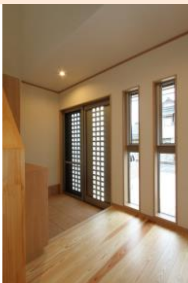
中から見た玄関 明るい雰囲気です