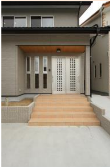
玄関アプローチ スロープもついています

構造材は福井県産材の杉を使いました。福井の気候に思いっきり調和しています。内装もふんだんに木を使っていますので、心身ともにすごしやすいと思います。