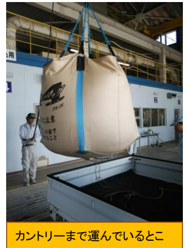
カントリーまで運んでいるところ