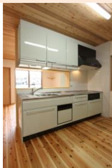
さわやかなグリーンのキッチン 床材は足腰にやさしい杉材です