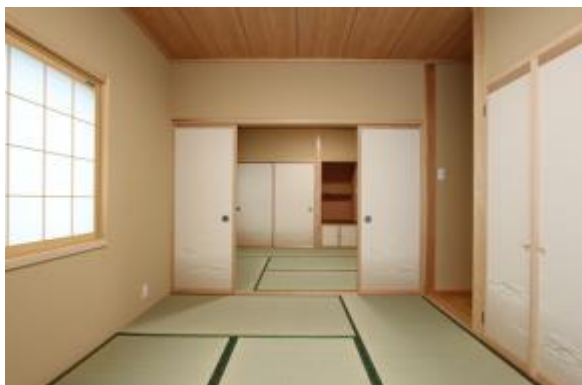
和室の2間つづき 落ち着いた雰囲気となっています