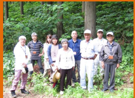
参加者のみなさんと記念撮影