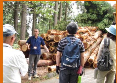
「木のプロ」西島社長が伐採された木を前に説明中