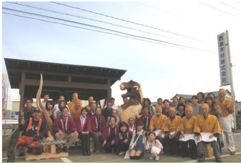
感謝祭が終わりスタッフ全員で記念撮影