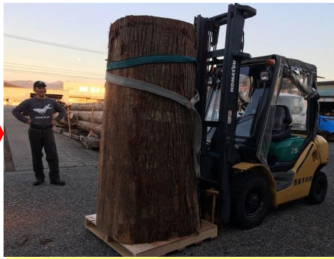
リフトにぎりぎり乗る丸太