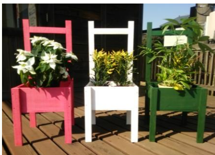
色は3色から選んでね