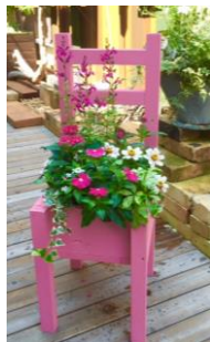
寄せ植えのイメージ