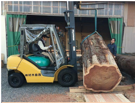
樹齢 102 年の福井県の杉