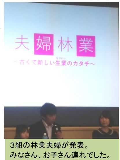
3組の林業夫婦が発表。 みなさん、お子さん連れでした。

男社会といわれてきた林業、木材業界も女性のパワーをすごーく感じる今日このごろです。私もがんばらなくっちゃ！