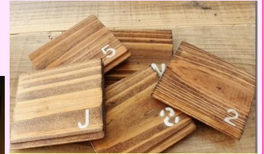
仕上がりイメージ