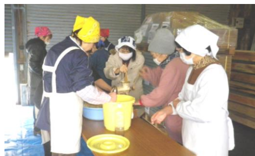
ゆでた大豆を機械でつぶしているところ。 右端が、うちの“おかん”です！