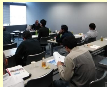
1月の「木の住まい教室」

先日の新聞では、「木質バイオマスエネルギー」の記事が出ていました。木材の可能性は未知ですね。