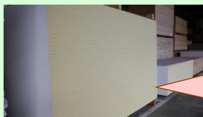
手前の黄色いのが石膏ボードです

タイカボードは漢字で書くと耐火ボード。文字通り防火性に富んでいます。また、遮音性も優れていて、かつ安価なので、内装下地で多く使われています